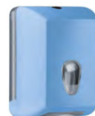
Azzurro 'Soft Touch' / trasparente A62221AZ