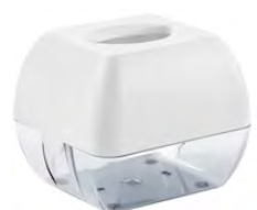
Bianco 'Soft Touch' / trasparente A90601BI

dimen. mm 138(H) x 149(D) x 163(W) - nr. 336 pcs./pallet