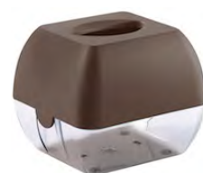
Marrone 'Soft Touch' / trasparente A90601MA