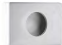
Bianco 'Soft Touch' A58401BI

dimen. mm 95(H) x 32(D) x 135(W) - nr. 3456 pcs./pallet