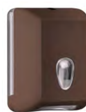
Marrone 'Soft Touch' / trasparente A62221MA