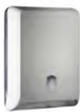
Bianco 'Soft Touch' / trasparente A83010EBI

dimen. mm 400(H) x 130(D) x 290(W) - nr. 84 pcs./pallet