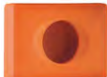
Arancione 'Soft Touch' A58401AR