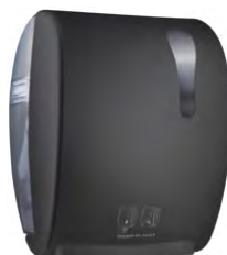
Nero 'Soft Touch' / trasparente A8752RNE