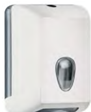
Bianco 'Soft Touch' / trasparente A62221BI

dimen. mm 215(H) x 125(D) x 160(W) - nr. 306 pcs./pallet