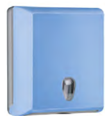
Azzurro 'Soft Touch' / trasparente A70610EAZ