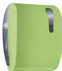
Verde 'Soft Touch' / trasparente A78050VE