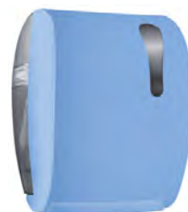
Azzurro 'Soft Touch' / trasparente A78050AZ