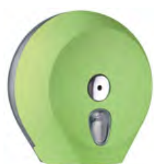
Verde 'Soft Touch' / trasparente A75610VE