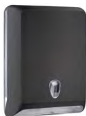
Nero 'Soft Touch' / trasparente A83010ENE