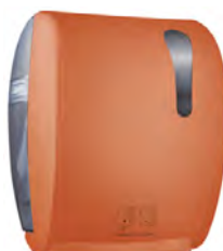
Arancione 'Soft Touch' / trasparente A8752RAR