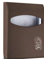
Marrone 'Soft Touch' / trasparente A66210MA