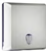
Bianco 'Soft Touch' / trasparente A70610EBI

dimen. mm 300(H) x 105(D) x 290(W) - nr. 144 pcs./pallet