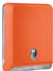
Arancione 'Soft Touch' / trasparente A83010EAR