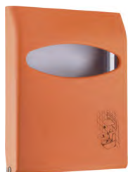
Arancione 'Soft Touch' / trasparente A66210AR