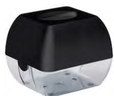
Nero 'Soft Touch' / trasparente A90601NE