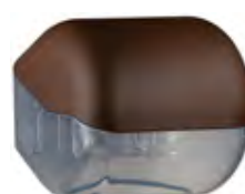
Marrone 'Soft Touch' / trasparente A61900MA