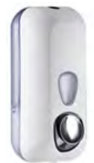
Bianco 'Soft Touch' / trasparente A71401BI

dimen. mm 228(H) x 90(D) x 102(W) - nr. 480 pcs./pallet