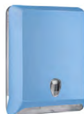
Azzurro 'Soft Touch' / trasparente A83010EAZ