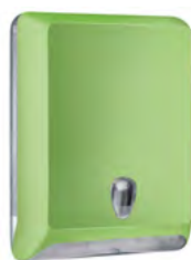
Verde 'Soft Touch' / trasparente A83010EVE