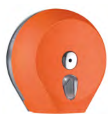
Arancione 'Soft Touch' / trasparente A75610AR