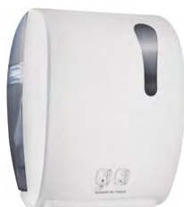
Bianco 'Soft Touch' / trasparente A8752RBI

dimen. mm 405(H) x 224(D) x 320(W) - nr. 50 pcs./pallet