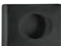
Nero 'Soft Touch' A58401NE