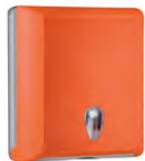
Arancione 'Soft Touch' / trasparente A70610EAR