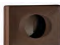
Marrone 'Soft Touch' A58401MA