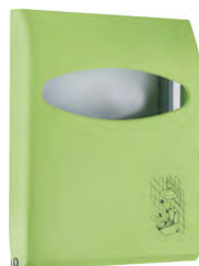
Verde 'Soft Touch' / trasparente A66210VE