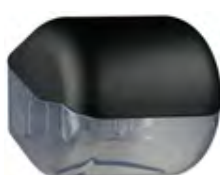
Nero 'Soft Touch' / trasparente A61900NE