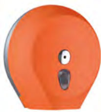
Arancione 'Soft Touch' / trasparente A75810AR