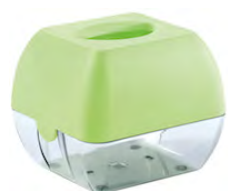
Verde 'Soft Touch' / trasparente A90601VE