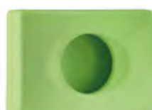
Verde 'Soft Touch' A58401VE