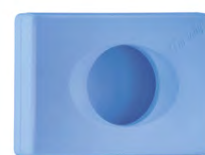
Azzurro 'Soft Touch' A58401AZ