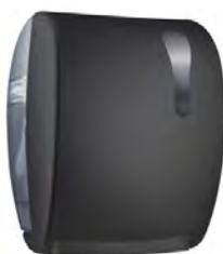
Nero 'Soft Touch' / trasparente A78050NE