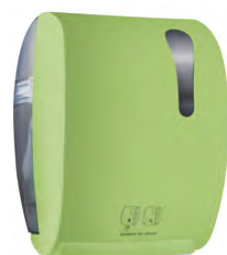
Verde 'Soft Touch' / trasparente A8752RVE