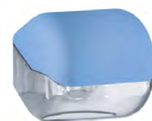
Azzurro 'Soft Touch' / trasparente A61900AZ