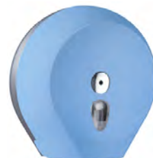
Azzurro 'Soft Touch' / trasparente A75810AZ