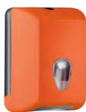
Arancione 'Soft Touch' / trasparente A62221AR