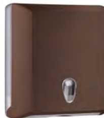
Marrone 'Soft Touch' / trasparente A70610EMA