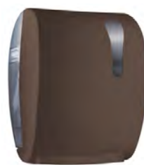
Marrone 'Soft Touch' / trasparente A78050MA