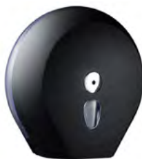
Nero 'Soft Touch' / trasparente A75810NE