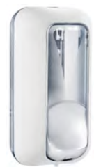
Bianco 'Soft Touch' / trasparente A89101BI

dimen. mm 217(H) x 117(D) x 103(W) - nr. 384 pcs./pallet