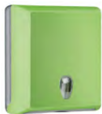
Verde 'Soft Touch' / trasparente A70610EVE