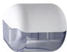
Bianco 'Soft Touch' / trasparente A61900BI

dimen. mm 140(H) x 148(D) x 150(W) - nr. 396 pcs./pallet