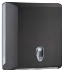
Nero 'Soft Touch' / trasparente A70610ENE