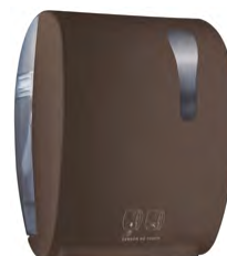
Marrone 'Soft Touch' / trasparente A8752RMA