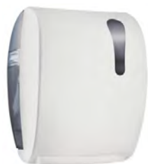
Bianco 'Soft Touch' / trasparente A78050BI

dimen. mm 405(H) x 224(D) x 320(W) - nr. 50 pcs./pallet