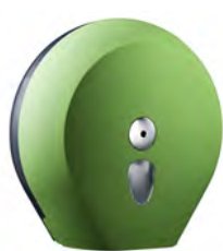
Verde 'Soft Touch' / trasparente A75810VE