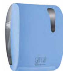
Azzurro 'Soft Touch' / trasparente A8752RAZ