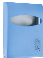
Azzurro 'Soft Touch' / trasparente A66210AZ