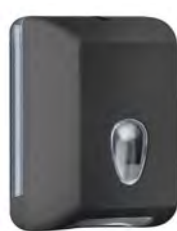
Nero 'Soft Touch' / trasparente A62221NE