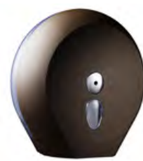
Marrone 'Soft Touch' / trasparente A75810MA