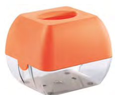
Arancione 'Soft Touch' / trasparente A90601AR