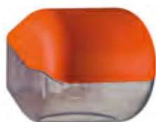
Arancione 'Soft Touch' / trasparente A61900AR