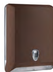
Marrone 'Soft Touch' / trasparente A83010EMA