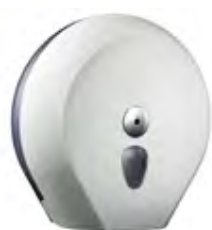
Bianco 'Soft Touch' / trasparente A75810BI

dimen. mm 335(H) x 128(D) x 335(W) - nr. 102 pcs./pallet