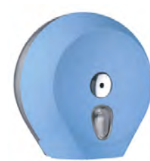
Azzurro 'Soft Touch' / trasparente A75610AZ