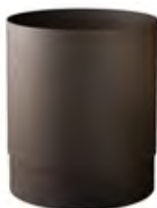
Marrone 'Soft Touch' A52601MA