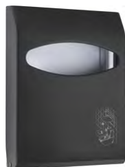
Nero 'Soft Touch' / trasparente A66210NE