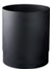
Nero 'Soft Touch' A52601NE

dimen. mm 290(H) x 250(D) x 250(W) - nr. 48 pcs./pallet