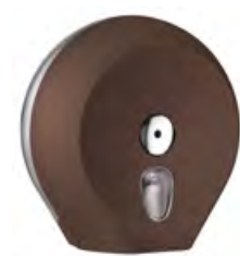
Marrone 'Soft Touch' / trasparente A75610MA