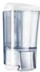
Bianco 'Soft Touch' / trasparente A76424BI

dimen. mm 150(H) x 55(D) x 73(W) - nr. 1440 pcs./pallet