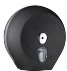
Nero 'Soft Touch' / trasparente A75610NE