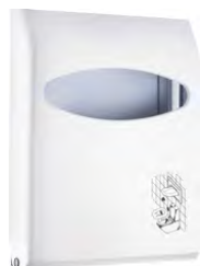
Bianco 'Soft Touch' / trasparente A66210BI

dimen. mm 295(H) x 60(D) x 230(W) - nr. 288 pcs./pallet