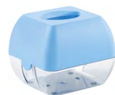
Azzurro 'Soft Touch' / trasparente A90601AZ

Porta scopino per bagno: - fissaggio a parete.