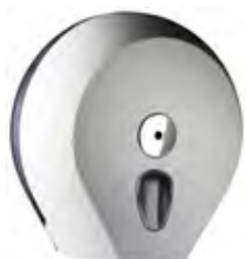
Bianco 'Soft Touch' / trasparente A75610BI

dimen. mm 273(H) x 128(D) x 270(W) - nr. 140 pcs./pallet