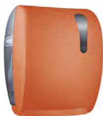
Arancione 'Soft Touch' / trasparente A78050AR