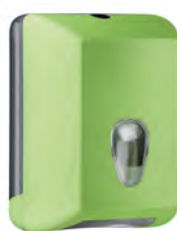
Verde 'Soft Touch' / trasparente A62221VE